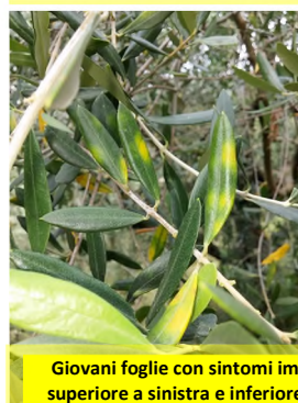
Giovani foglie con sintomi imputabili a cercosporiosi –pagina superiore a sinistra e inferiore (con piombatura) a destra (SC)