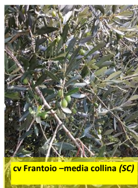
cv Frantoio –media collina (SC)

Attenzione: Il prossimo bollettino Olivo verrà emesso il 20 settembre