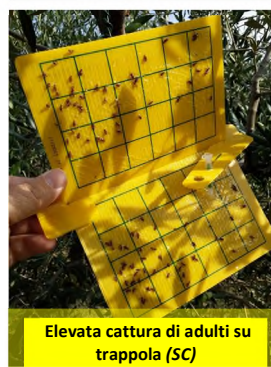
Elevata cattura di adulti su trappola (SC)