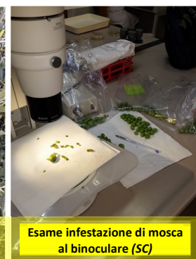
Esame infestazione di mosca al binoculare (SC)